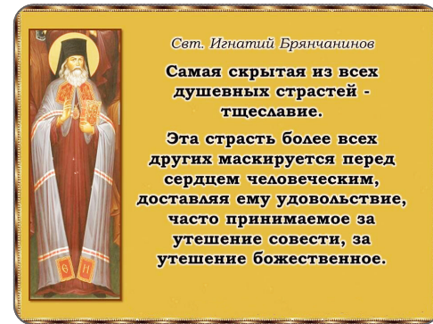
Свт. Игнатий Брянчанинов

Господи, прости нас, мы все страдаем этим недугом! Что же питает человеческое тщеславие? Человеческая похвала! А как мы любим, чтобы нас хвалили люди! Уж если немного совестно бывает, что хвалят в глаза, то как хочется нашему тщеславию, чтобы хвалили нас заочно и думали о нас хорошо. На почве тщеславия вырастает ещё одна страсть — лицемерие, то есть стремление разыгрывать из себя благочестивого человека, не будучи таковым на самом деле.